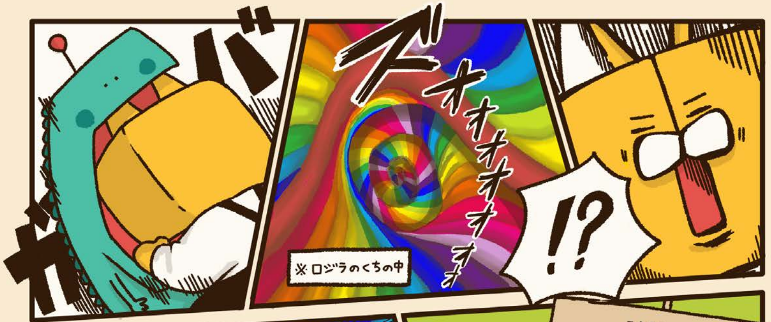
※ ロジラのくちの中